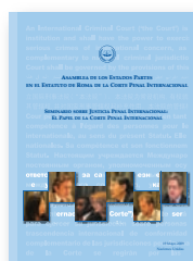
Seminario sobre justicia penal internacional