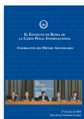
El Estatuto de Roma - Celebración del Décimo Aniversario