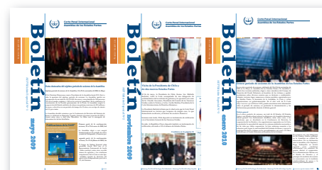
Boletín – Asamblea de los Estados Partes, edición especial No.1 – mayo de 2009 No.2 – noviembre de 2009 No.3 – enero de 2010 también están disponibles en línea

Secretaría de la Asamblea de los Estados Partes Corte Penal Internacional