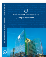
Selección de Documentos Básicos relacionados con la Corte Penal Internacional