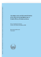
Documentos Oficiales de la Asamblea de los Estados Partes (Volumen I y II)

Publicaciones de la Asamblea de los Estados Partes (disponibles en árabe, español, francés e inglés):