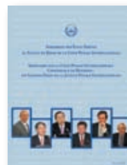
Séminaire sur la Conférence de révision du Statut de Rome : Principaux défis pour la justice pénale internationale