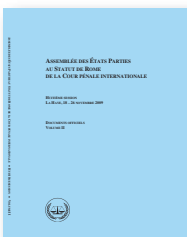
Documents officiels de l'Assemblée des États Parties (Volume I et II) et de la Conférence de révision