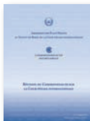
La réunion du Commonwealth sur la Cour pénale internationale