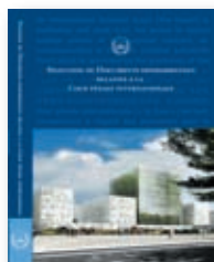
Sélection de Documents fondamentaux relatifs à la Cour pénale internationale