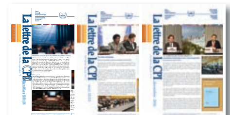
La lettre de la CPI - AEP Edition spéciale No 1 - 2009 mai No 2 - 2009 novembre No 3 - 2010 janvier No 4 - 2010 mai No 5 - 2010 décembre