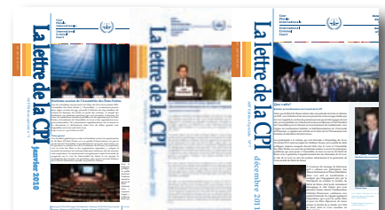
La Lettre de la CPI - APE Edition spéciale

2009 - n° 1, 2 2010 - n° 3, 4, 5 2011 - n° 6, 7