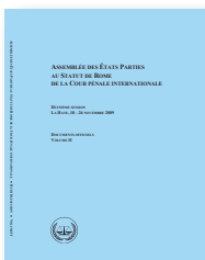
Documents officiels de l'Assemblée des États Parties (Volumes I et II) et de la Conférence de révision

Publications de l'AEP (disponibles en arabe, anglais, français et espagnol) :