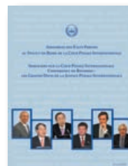
Séminaire sur la Conférence de révision de la CPI : Les principaux défis de la justice pénale internationale