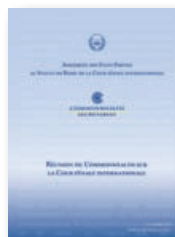
Réunion du Commonwealth sur la Cour pénale internationale