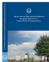
Selección de documentos básicos relacionados con la Corte Penal Internacional