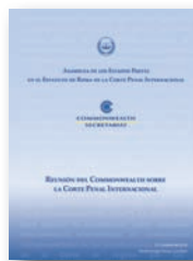
Reunión del Commonwealth sobre la Corte Penal Internacional