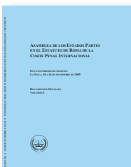
Documentos Oficiales de la Asamblea de los Estados Partes (Volúmenes I y II) y de la Conferencia de Revisión