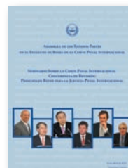
Seminario sobre la Conferencia de Revisión de la Corte Penal Internacional: desafíos clave para la justicia penal internacional