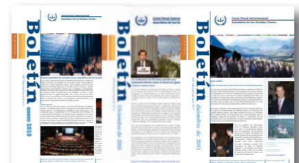
Boletín - Edición especial de la Asamblea de los Estados Partes 2009 - No.1, 2 2010 - No.3, 4, 5 2011 - No.6, 7