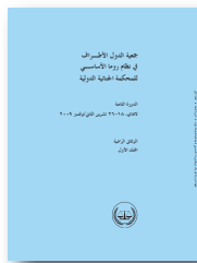
الوثائق الرسمية لجمعية الدول الأطراف (المجلد الأول والثاني) المؤتمر الاستعراضي