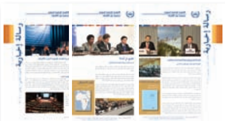
Newsletter - ASP Special Edition No.1 - 2009 May No.2 - 2009 November No.3 - 2010 January No.4 - 2010 May No.5 - 2010 December