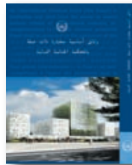
وثائق أساسية مختارة ذات صلة بالمحكمة الجنائية الدولية