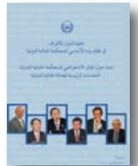
ندوة حول المؤتمر الاستعراضي لنظام روما الأساسي: التحديات الرئيسية للعدالة الجنائية الدولية