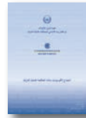
اجتماع الكومنولث بشأن المحكمة الجنائية الدولية