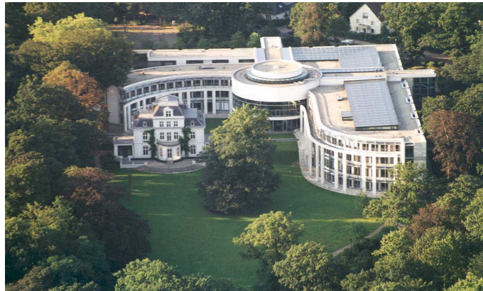
国际刑事法院，荷兰海牙