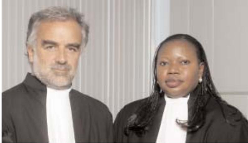
Mwendesha mashtaka, Luis Moreno-Ocampo na wendesha mashtaka makamu, Fatou Bensouda