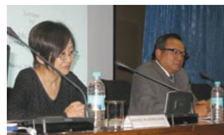
La magistrada Kuniko Ozaki dio una conferencia en Kuala Lumpur el 26 de marzo de 2010 en una reunión de la Organización Consultiva Jurídica Asiático-Africana.