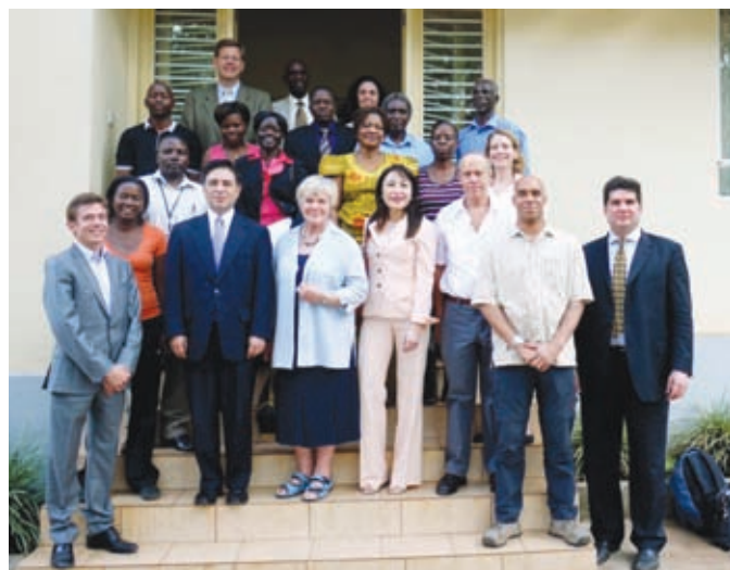
Los delegados con el personal de la Oficina de la Corte sobre el Terreno en Kampala, en febrero