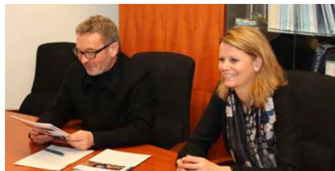
Durante la entrevista

Un presupuesto estricto ha sido fijado para el proyecto y los Estados Partes son prudentes en cuanto a un posible rebasamiento de los gastos. ¿Cómo puede usted, como arquitecto, contribuir al respeto del presupuesto? ¿Sus antiguos proyectos han respetado los presupuestos?