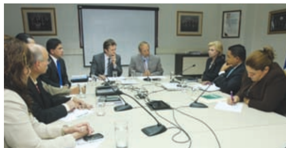
Izquierda: Con el Ministro de Defensa, Sr. David Munguía Payés