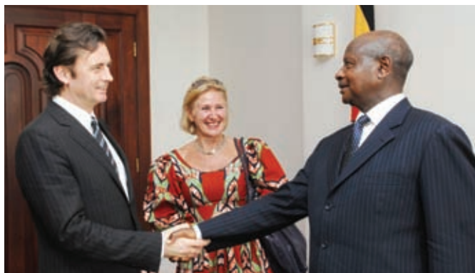
El Excmo. Sr. Presidente Yoweri Kaguta Museveni de la bienvenida al Embajador Wenaweser, Presidente de la Asamblea, en presencia de la Embajadora Mirjam Blaak (Uganda)

Las ONG No Peace Without Justice y HURINET-U organizaron otras tres visitas, del 11 al 17 de febrero, del 29 de marzo al 2 de abril, y del 4 al 7 de mayo de 2010.