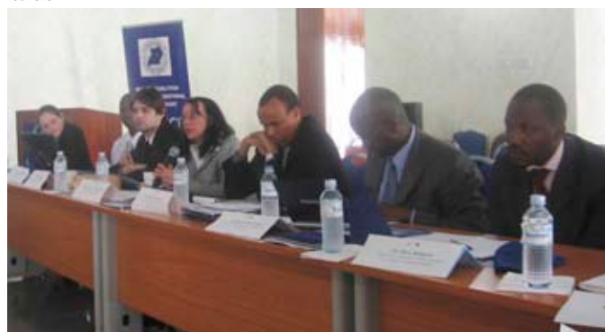
Visita de marzo