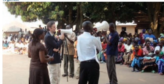
El Presidente Wenaweser visitando la comunidad local del subcondado de Pabo