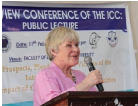
La Sra. Rehn dirigiéndose a los estudiantes de la Universidad de Makerere