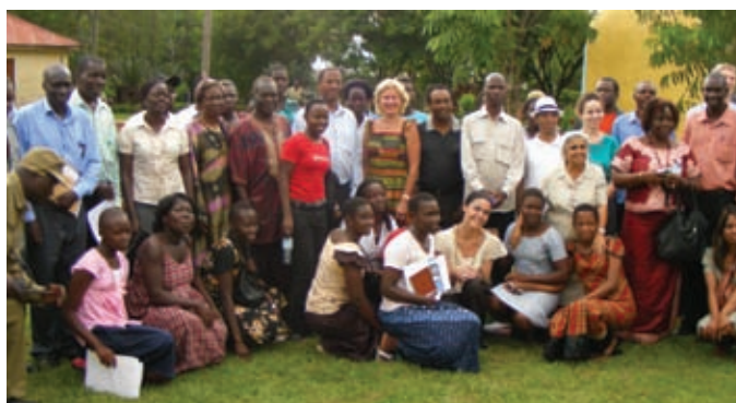
Visita de mayo