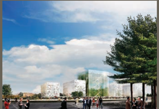
El diseño de schmidt hammer lassen

Al diseñar un edificio compacto que ocupa poco espacio, las dunas y el cielo forman parte integral de la composición arquitectónica. La composición del paisaje está destinada a cumplir con los requisitos de alta seguridad de la Corte, sin comprometer la visibilidad de ésta hacia el mundo exterior.