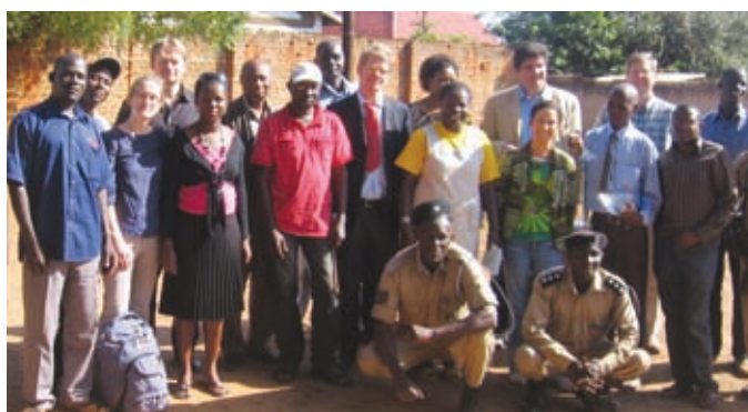
Visita de enero