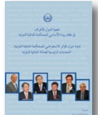
ندوة حول المؤتمر الاستعراضي للمحكمة الجنائية الدولية: التحديات الرئيسية للعدالة الجنائية الدولية