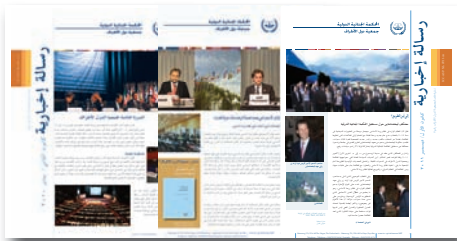
رسالة إخبارية - جمعية الدول الأطراف

٢٠٠٩ - رقم ٢٠١ ٢٠١٠ - رقم ٢٠٤ ٢٠١١ - رقم ٢٠٦