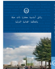
وثائق أساسية مختارة ذات صلة بالمحكمة الجنائية الدولية