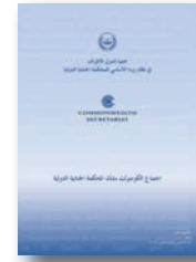
اجتماع الكومنولث حول المحكمة الجنائية الدولية